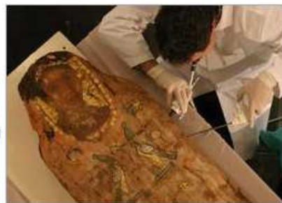
Científicos trabajan con la Dama de Kemet / Museo Egipcio de Barcelona