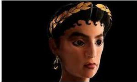
Así era la Dama de Kemet / Museo Egipcio de Barcelona